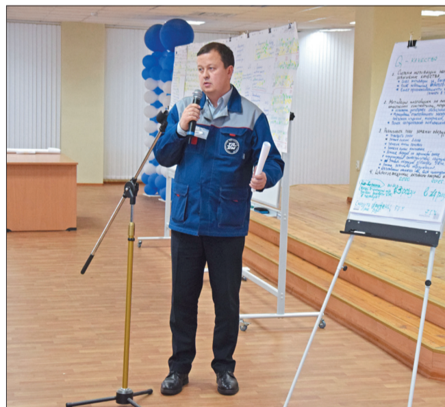
Отчёт группы «Производство, инфраструктура»