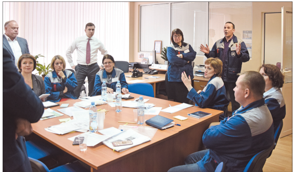
Группа «Персонал, управление» обсуждает потребности производства в квалифицированном персонале

ложила пути развития системы продаж и сервиса, в том числе ремонта двигателей на заводе. Группа «Продукты, технологии» разрабатывала оптимизацию и развитие существующей продуктовой линейки, определила перспективные виды продукции. Группа «Производство, инфраструктура» провела оценку возможностей по снижению затрат, повышению качества, эффективной модернизации производства. Группа «Экономика, финансы» работала над экономической моделью развития, снижением затрат на закупки, развитием системы инвестиционного про-