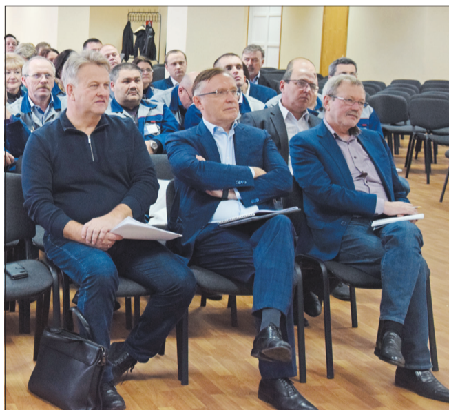
Подведение итогов сессии стратегического планирования

Сессия - только начало большой работы. Будет построена финансовая модель развития предприятия до 2025 года. Необходимо расширить номенклатуру выпускаемой продукции, максимально быстро освоить производство новых видов продукции, работать над оптимизацией производственного процесса и структурой управления.