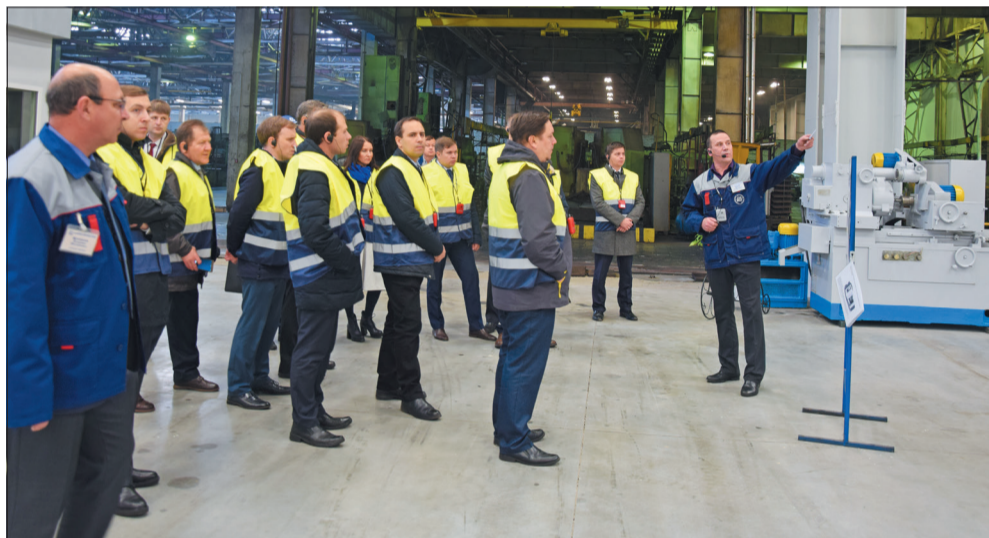
Делегация КАМАЗа в МСЦ

ектирования и управления проектами. Группа «Персонал, управление» наметила мероприятия по повышению производительности труда и подготовке персонала.