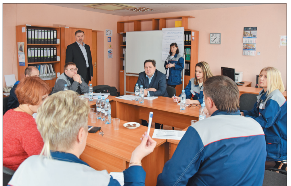
Работа группы «Рынок, продажи, сервис»