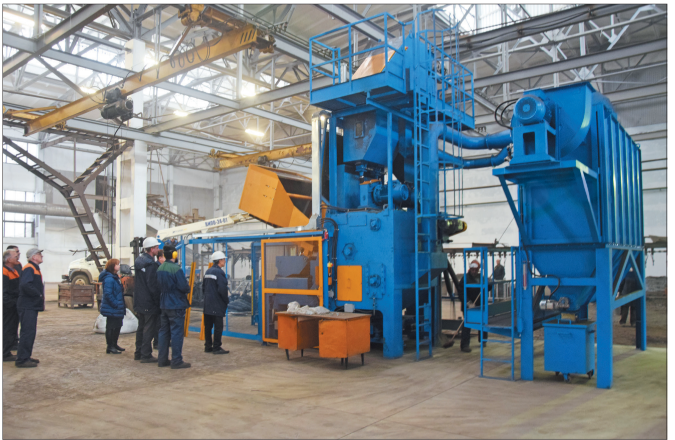
Загрузка отливок в дробемётный барабан