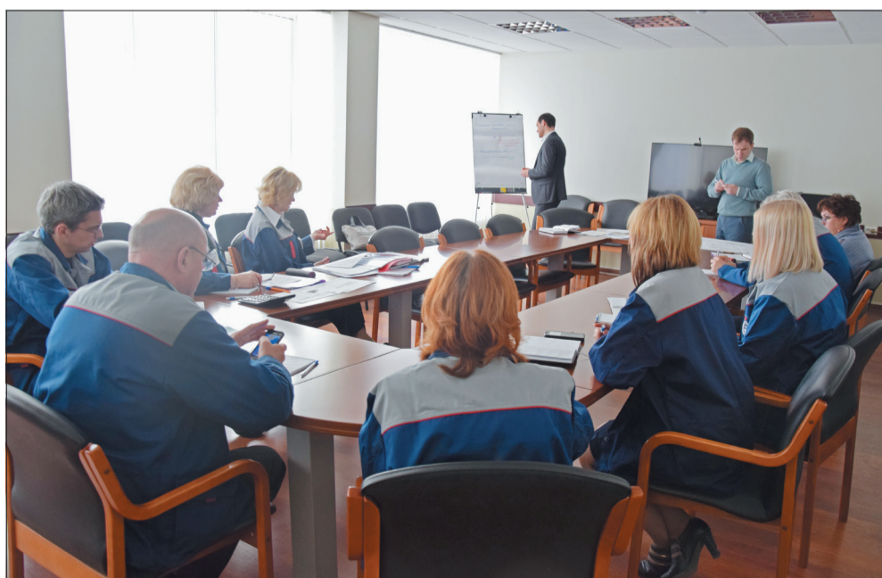
Работа группы «Финансы, экономика»