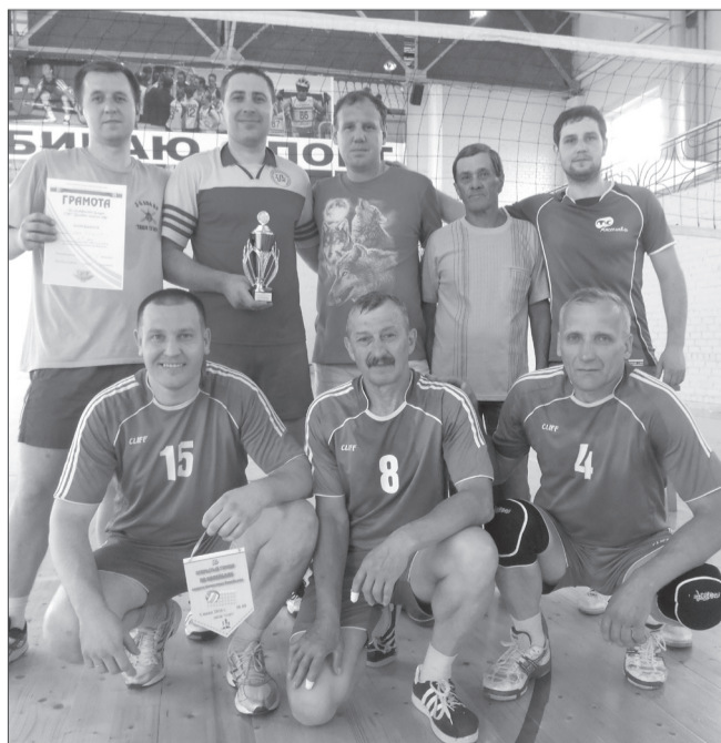
Волейбольная команда завода