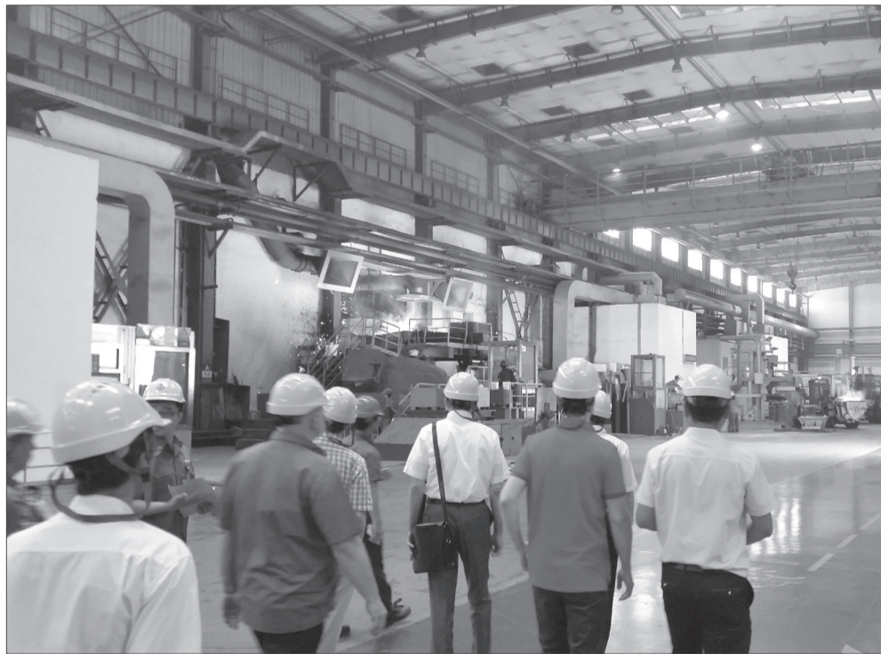
Литейный цех завода WEICHAI

Визит в Китай специалистов ТМЗ и КАМАЗа был необходим для изучения конструкции двигателя WEICHAI POWER и технологии его производства.