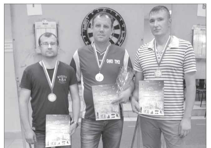
Победители Открытого кубка Ярославля по дартсу

28 – 29 мая во время празднования Дня города в Ярославле прошёл Открытый кубок по игре в дартс.