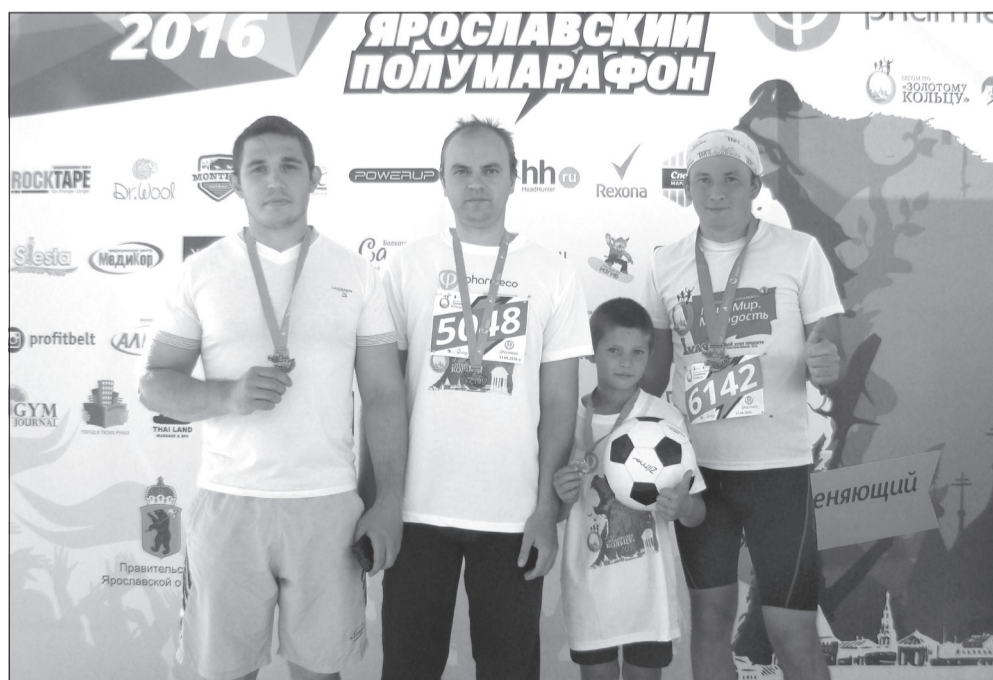
Участники полумарафона из Тутаева

стейеров страны лучшими оказались москвичи. Трое из четверых участников чемпионата России завоевали места на пьедесталах. Второе место заняли представители Самарской области, третье – сборная Хакасии.