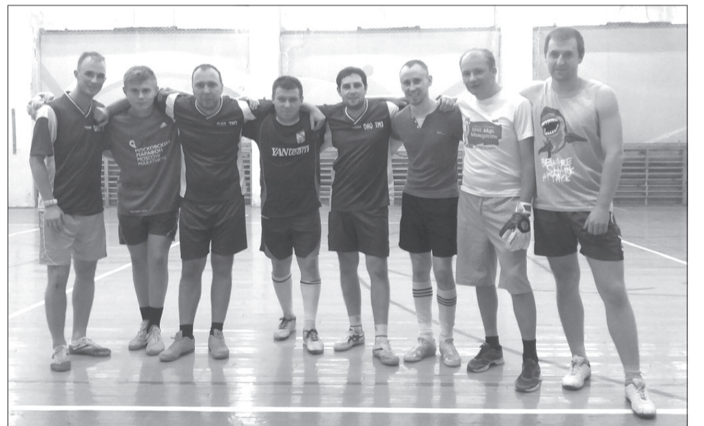
Команда ТМЗ по мини-футболу