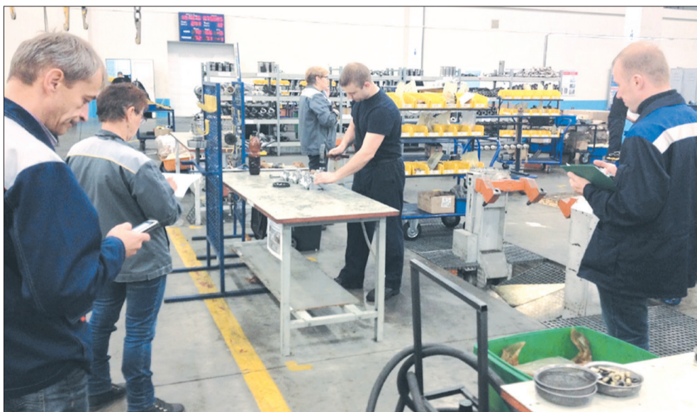
Анализ работы на участке сборки двигателей

На подборке фильтра тонкой очистки топлива 840.1117070 рассматривается несколько вариантов перепланировки рабочего места. Перепланировка позволит уменьшить количество переме-