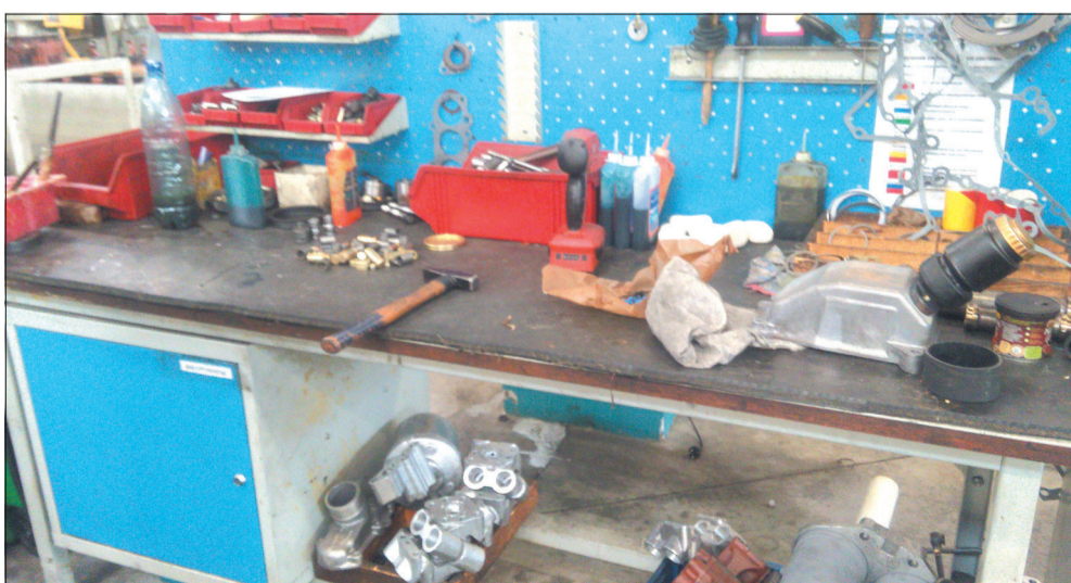
Рабочее место слесаря МСР. БЫЛО

Сделать предстоит ещё немало, причём не только силами ГРПС и механосборочного цеха, но и службой технологической подготовки производства, отделом технического контроля, службой управления персоналом. Нужно, чтобы порядок в начале и в конце рабочей смены стал нормой. Необходимо разработать стандарт трёхуровневого аудита по системе 5С (культуре производства), решить проблемы с тарой. Будет проведён анализ и разработаны предложения по изменению оплаты труда для повышения мотивации персонала. Главное, по мнению тех, кто уже включился в процесс улучшений, иметь желание и позитивный настрой, и все поставленные цели будут достигнуты.