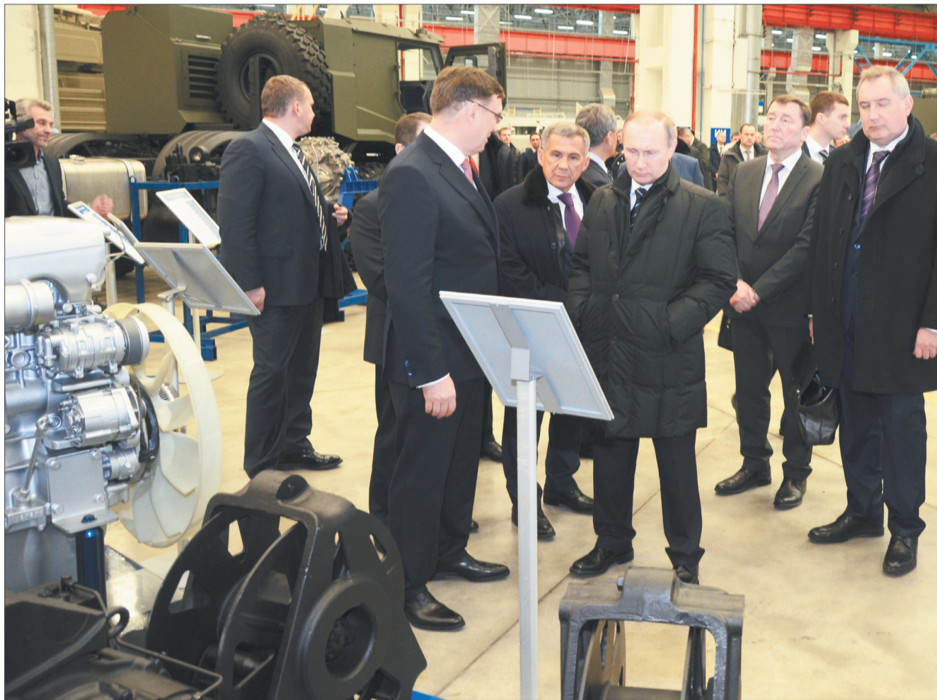
Президент РФ Владимир ПУТИН на КАМАЗе у стенда с автомобильными лебедками производства ОАО «ТМЗ»

12 февраля посетившему КАМАЗ Президенту РФ Владимиру Путину были показаны образцы автомобильных лебедок, изготовленные на ТМЗ по заказу КАМАЗа в рамках программы импортозамещения. В бизнес-плане ОАО «ТМЗ»