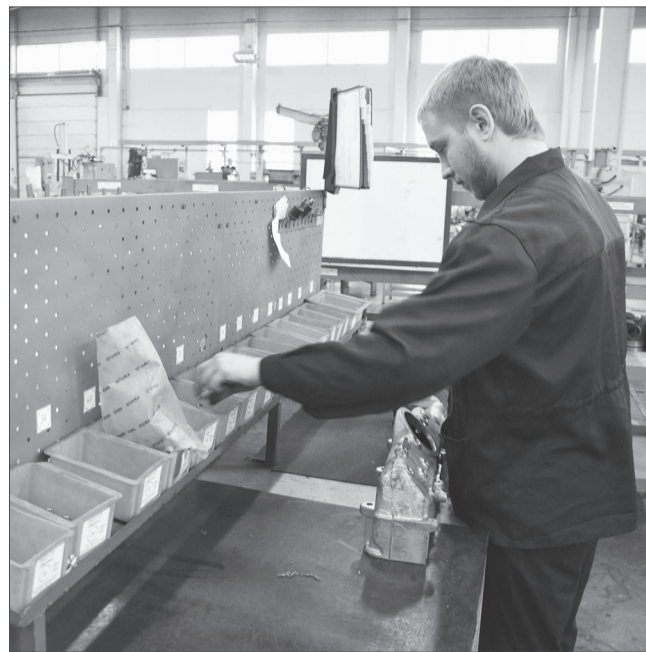
Подсборка алюминиевых деталей