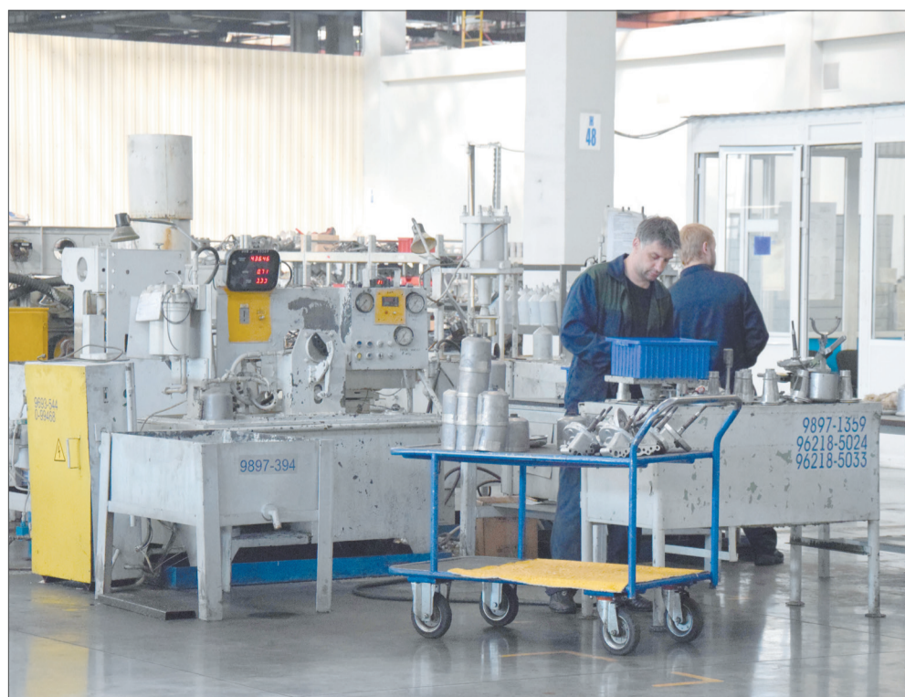
Участок узловой сборки

доукомплектовку двигателей. Здесь собранные моторы доукомплектовываются выхлопными коллекторами, турбокомпрессорами, ВМР, масляными фильтрами, рычагами управления ТНВД. Здесь же проводится опрессовка двигателя, и он сдаётся на испытания. Эти операции позволяют перераспределять силы и экономить у основных сборщиков в среднем около полутора часов. В дальнейшем этот процесс будем совершенствовать. Заказаны электротележки, на которых будет проводиться доукомплектовка и отправка двигателя на станцию испытания. Сам участок доукомплектовки в будущем должен представлять собой мини-конвейер с четырьмя